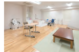
家庭護理學實習室 在宅看護学実習室