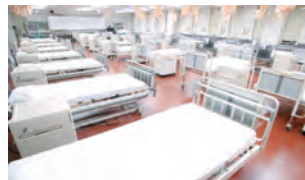
基礎護理學實習室 基礎看護学実習室

本校為每個領域配備了用於實踐性地學習護理技術的實習室，例如，「基礎護理學實習室」，學生們可以利用最新的學習系統掌握專業護理援助的基礎技術，「家庭護理學實習室」，學生可以了解居家療養的意義，並習得以日常生活為中心的家庭護理援助基本知識。