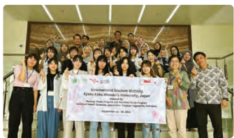
與印度尼西亞學生的交流 インドネシアの学生との交流

在全球化的進程中，無論國內外，為具有不同文化背景的人們提供護理的機會日益增多。除了學習護理知識和技能外，通過海外護理研修和短期留學的海外研修項目，與志同道合的外國學生進行國際交流，從而培養全球視角，並追求尊重多樣性的護理服務。 ※海外研修僅限有意願者參加。