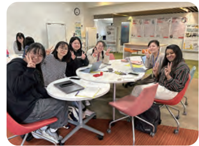
日語社區 日本語コミュニティ